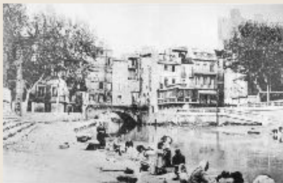
Les Lavandières Narbonnaises.....

Nous ne ménagerons pas nos efforts, pour que demain nos enfants puissent à nouveau, comme nos grands-parents jadis, jouir d'une eau dépolluée et voir le fond des eaux des canaux de la Narbonnaise.